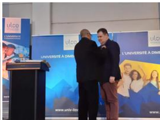
Remise des Palmes académiques à l'ULCO