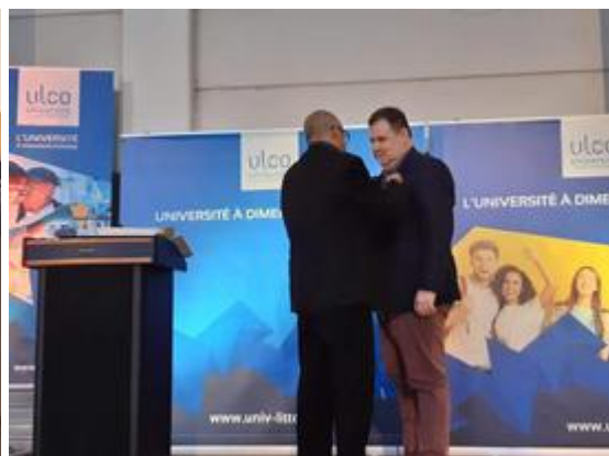
Remise des Palmes académiques à l'ULCO